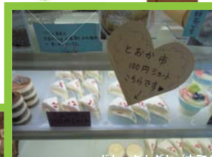
ガトータカダヤ (本町3) *去年度実施時の様子 (ご注意：4月実施 内容ではありません。)

実施店舗・内容は まちなかのすウインドウで ご覧いただけます。 フェイスブックでも発信します！